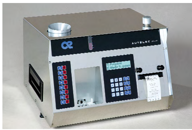
El medidor de contenido de grasa y acidez MG-707 es un sistema que garantiza una gran exactitud y fiabilidad.

etapa al dejar de trabajar para terceros y crear una línea propia de productos dirigida al mercado del aceite de oliva, habiendo comercializado desde entonces más de 2.000 equipos. La relación de proyectos desarrollados por Autelec incluye el determinado de contenido de aceite para aceituna, orujo y otros productos (1989); medidor de alcohol probable en mosto de uva (1992); medidor de la cantidad de aceite producida por las extractoras en almazaras (1993); equipo medidor de baja resolución -baja frecuencia- de resonancia magnético-nuclear para determinar el contenido de aceite en aceituna (1998), desarrollado en colaboración con el Institute of Physics & Nuclear Engineering de Bucarest y el centro tecnológico Ainia (1998); analizador de humedad y grasa para oleaginosas (Ahurigo) por infrarrojo cercano NIR (2002), en colaboración con el Ainia; o el proyecto Olimatic, desarrollado dentro del Seventh Framework Programme de la Comisión Europea (2009).