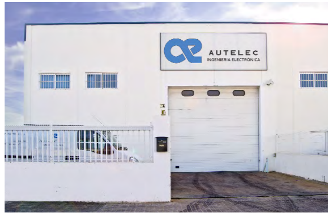
Fachada de las actuales instalaciones de Autelec Tecnología en Pobla de Vallbona (Valencia).