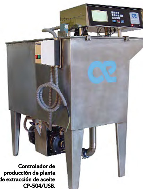
Controlador de producción de planta de extracción de aceite CP-504/USB.

La envasadora semiautomática, uno de los productos estrella de Autelec, ha sido sometida en 2014 a una profunda revisión con vistas a su