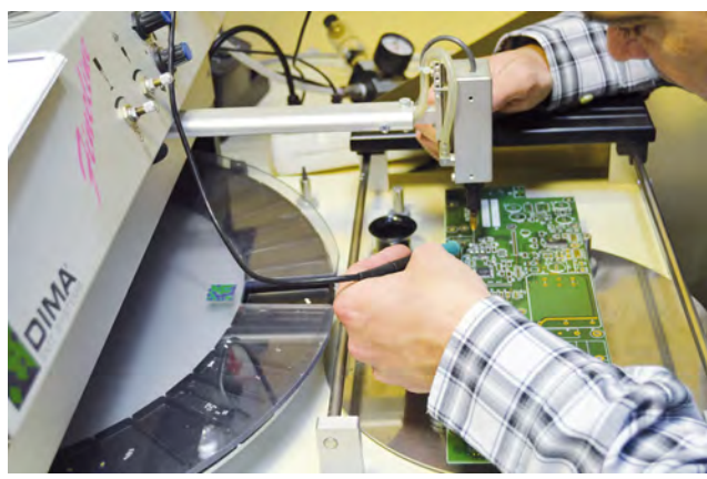
Sala de montaje de microelectrónica.