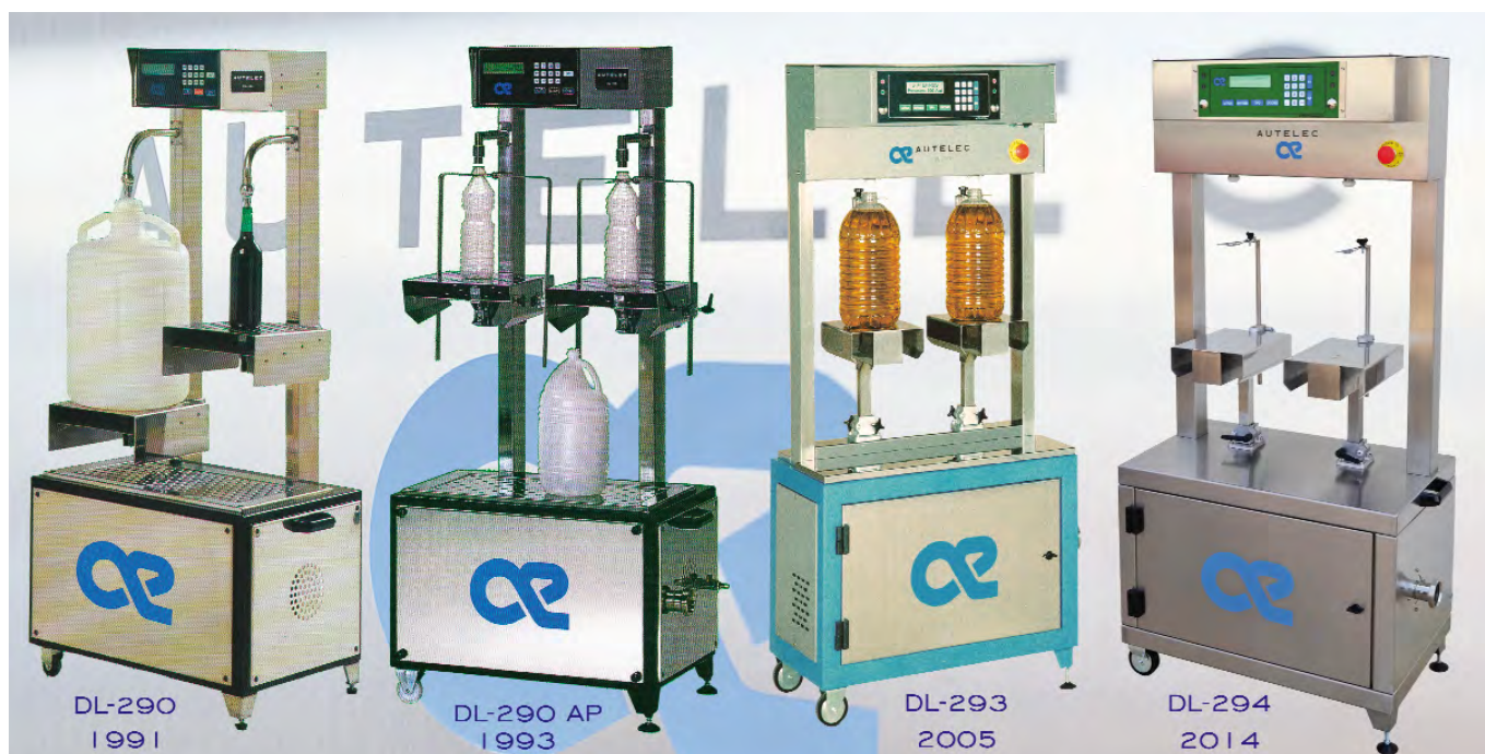
Evolución de la popular envasadora semiautomática de Autelec desde el primer modelo lanzado en 1991, el DL-290, hasta la nueva DL-294 (2014).

Fundada en 1979, Autelec es una empresa de capital 100% español dedicada al diseño y fabricación de equipos y maquinaria electrónica aplicada a la industria agroalimentaria especializada en el sector del aceite de oliva, en el que goza de un merecido prestigio gracias a la calidad, innovación y fiabilidad de sus equipos. La compañía valenciana afronta una nueva etapa con cambios en la gerencia pero con la misma ilusión de siempre por ofrecer el mejor servicio y asesoramiento profesional al sector oleícola y olivarero.