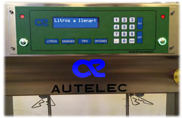
La envasadora de aceite por peso DL-294 Plus destaca por su equilibrio y gran fiabilidad.

tamente. Por tanto, podemos decir que nuestro camino está guiado por los propios usuarios y asesorado por nuestro equipo de técnicos”.