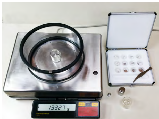
Báscula de alta precisión empleada para el control de calidad.

[ En el caso de las envasadoras, el tiempo medio transcurrido desde su instalación hasta el primer desajuste asciende a más de una década ]