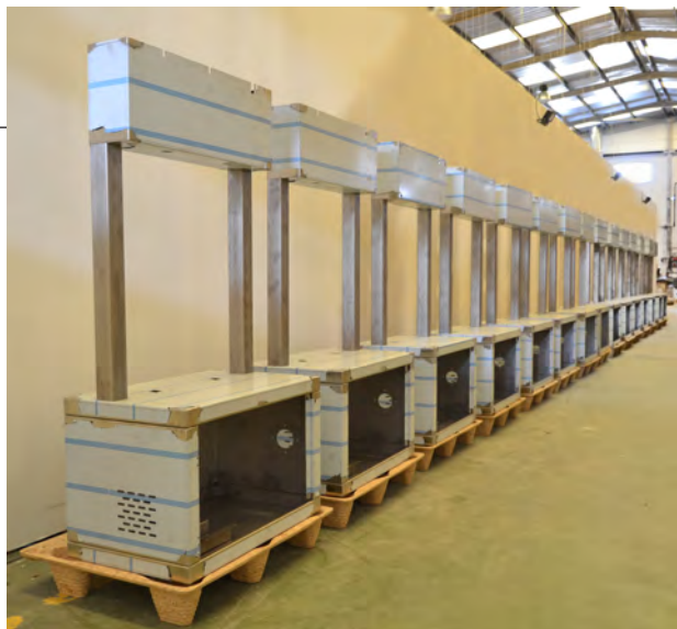
Autelec lleva fabricando envasadoras por peso desde hace casi 30 años.