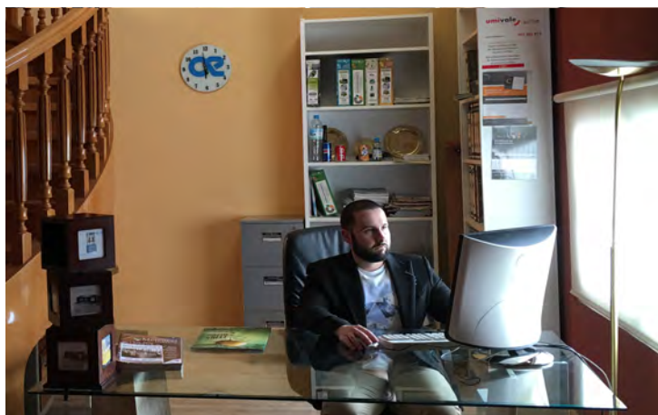
El servicio de atención al cliente de Autelec busca siempre la solución más rápida y económica para que sus equipos funcionen a pleno rendimiento.