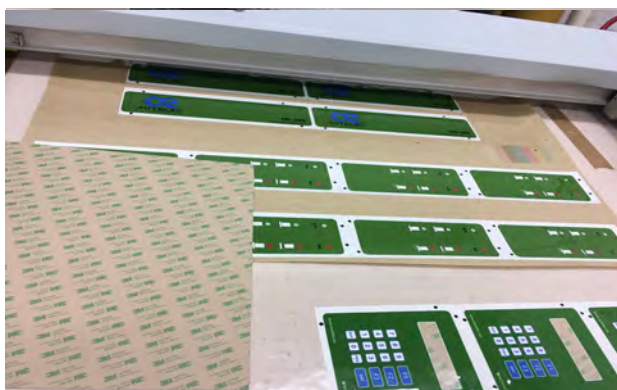
Detalle del diseño de los frontales de las máquinas.